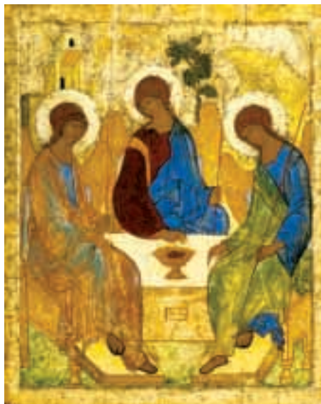
ТРОИЦА прп. Андрея Рублева

Исходивший с неба необычайный шум, как от несущегося ветра, привлёк к дому апостолов народ, пришедший в Иерусалим на праздник Пятидесятницы. Этот праздник отмечался в память дарования израильтянам Закона Божия. Среди людей, пришедших тогда в Иерусалим, находились иноземцы из пятнадцати стран. Это были и купцы с берегов Чёрного моря, и чернокожие