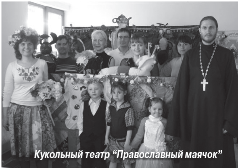
Кукольный театр «Православный маячок»

Веселье в полном разгаре, когда вдруг появляется злодей – Паук и гро-