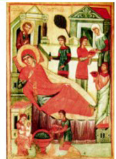
Икона "Рождество Пресвятой Богородицы"

Рождество Божией Матери ознаменовало наступление времени, когда начали исполняться великие и утешительные обетования Божии о спасении рода человеческого от рабства диавола. Это событие приблизило на земле благодатное Царство Божие, царство истины, благочестия, добродетели и бессмертной жизни. Мать Первороденного всея твари является и всем нам по благодати Матерью и милосердной Заступницей, к Которой мы постоянно прибегаем с сыновним дерзновением.